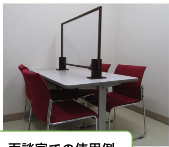
面談室での使用例