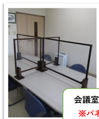
会議室での使用例 ※パネル3枚使用